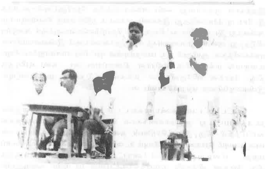
நோர்ஜூட் கண்டனக் கூட்டம் திருவாரூர் பராகரம் மன்ற விழுவர். பராகரம் சுபீரமனியம். அ. இளங்கீசரியன் மகலியோர் அரங்கீதம் திரு. விளர் சிவன் உபையாற்கிவர்