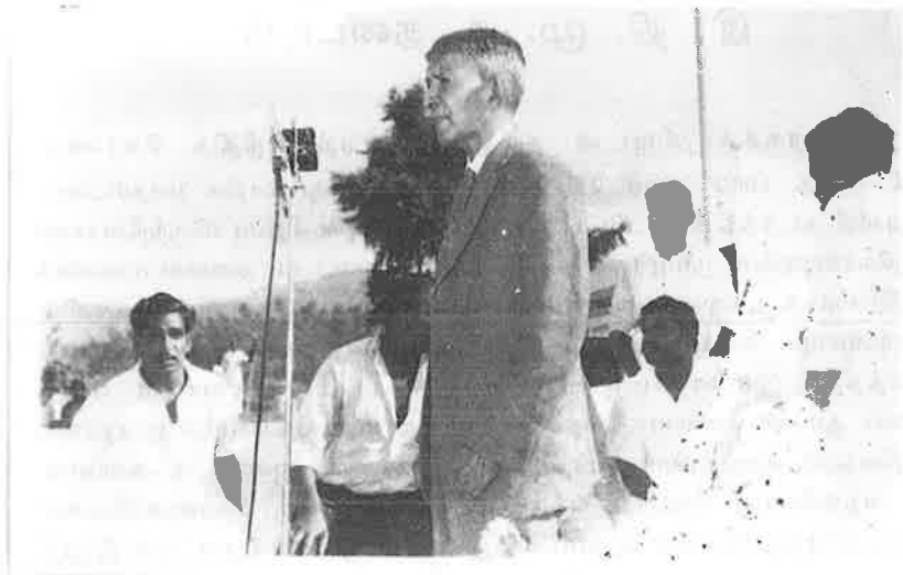
இ.தி.மு.க. ஹற்றன் மகாநாட்டில் தந்தை சென்வா உரையாற்றுகிறார்