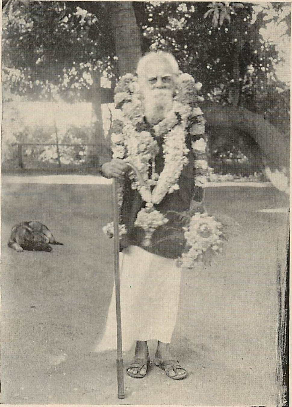
1954-ல் பர்மாவில் பெரியார் ஈ. வெ. ரா. அவர்கள்