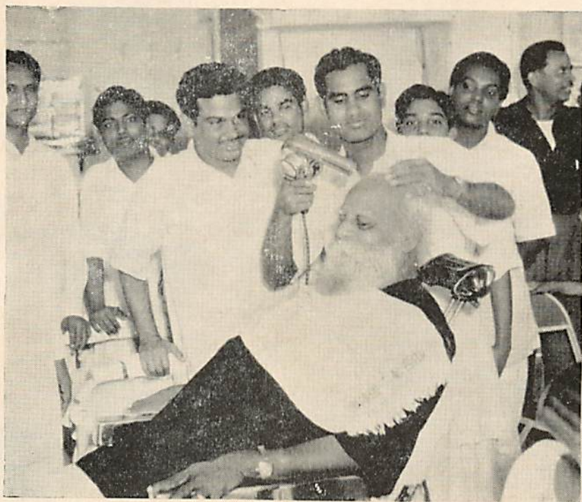
பெரியார் ஈ. வெ. ரா. அவர்கள் 1954-ல் பர்மாவில் நடைபெற்ற உலக பவுத்த மாநாட்டுக்குச் சென்றிருந்தபோது வரவேற்கப்படுகிறார். (மேலே) அங்கு ஒரு முடிதிருத்தகத்தில் முடிதிருத்தம் (Shampoo) செய்துகொள்கிறார். (கீழே)