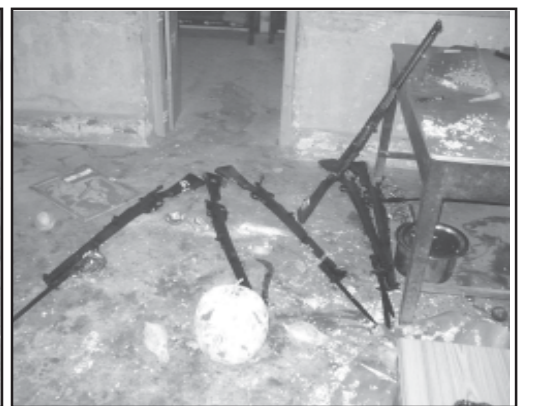
காவல் நிலையத்தில் பூசைப் பொருட்கள் சிதறிக் கிடக்கும் காட்சி