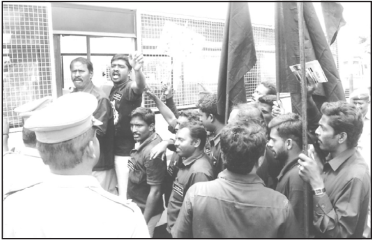
வருவதைக் கண்டித்து கோவையில் கழகத் தோழர்கள் தடையை மீறி ஆர்ப்பாட்டம் செய்தனர். 13 ஆம் தேதி இரவு