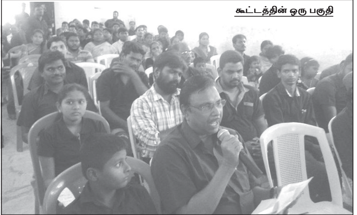
கூட்டத்தின் ஒரு பகுதி

கொண்டாடாத முஸ்லிம், கிறித்துவர்கள் கூட தீபாவளி நாளில் வீடுகளில் தொலைக்காட்சிகளில் சிறப்பு நிகழ்ச்சிகளைப் பார்த்துக் கொண்டிருக்கிறார்கள். விழாக்கள், கொண்டாட்டங்களை விரும்பும் உளவியல் மக்களை சிந்திக்க விடாமல் தடுத்து விடுகிறது. தீபாவளியை கொண்டாடவே கூடாது, புறக்கணிக்க வேண்டும் என்று பெரியார் இயக்கம் நீண்டகாலமாக பரப்புரை செய்து வருகிறது. எனவே கொண்டாடவே கூடாது என்ற கொள்கைகளுக்கு நாம் மாற்று தேடுவது சரி தானா” என்ற விவாதத்தை முன் வைத்தார்.