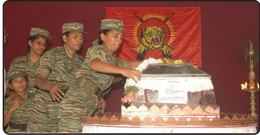
தமிழ்ச்செல்வன் துணைவியார் வீரவணக்கம் செலுத்துகிறார்; அருகில் அவரது மகள்

தமிழீழத் தாயகத்தில் வீர வணக்ககூட்டம் நடைபெற்ற அதேநேரத்தில் புலம்பெயர் தமிழர்கள் வாழும் அனைத்து நாடுகளிலும் சமநேரத்தில் பிரிகேடியர் சு.ப.தமிழ்ச்செல்வனின் விதைகுழியில் விதைக்கப்பட்டது.