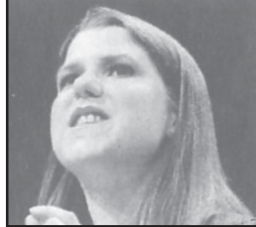
அமைச்சர் ஜோ அவின்சன்

பிரிட்டனில் ஜாதி வேற்றுமை சட்டப்படி தடை செய்யப்பட்டுள்ளது. இந்த வரலாற்றுச் சிறப்பு மிக்க தீர்மானம் பிரிட்டன் பொதுச் சபையில் கடந்த செவ்வாய்கிழமை (ஏப். 23) நிறைவேறியது. பிரிட்டனில் குடியேறிய ‘தலித்’ மக்களின் நீண்டகாலப் போராட்டத்துக்குக் கிடைத்த வெற்றி இது. பிரிட்டனில் ‘சமத்துவ சட்டம் 2010’ இல் இனம், மரபு, குலம் என்ற அடிப்படையில் பாகுபாடு காட்டுவது ஏற்கனவே தடைசெய்யப்பட்டுள்ளது. இதில் ‘ஜாதி’ என்பதையும் இணைக்க வேண்டும் என்று அங்கே இந்நியாவிலிருந்து குடியேறிய ‘தலித்’ மக்கள் வற்புறுத்தி வந்தனர். இப்போது அந்தச் சட்டத்தில் ஜாதி என்பதும் சேர்க்கப்பட்டு விட்டது. பார்ப்பன-உயர்ஜாதியினர் இதற்கு எதிராகக் குரல் கொடுத்ததோடு, இந்தக்