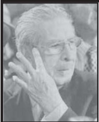
இராஃபின் ரியோஸ் மான்ட் மரயான்.

ராஜபக்சே நாடாளுமன்றத்தில் 'மனசாட்சி' அடிப்படையில் வாக்குகளைப் பெற வேண்டும் 4 ஆம் பக்கம்