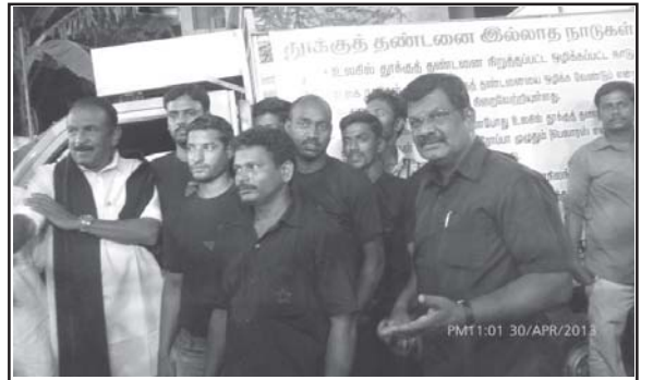
இந்தப் பயணத்தைத் தொடங்கி வைத்தார்.

ஏப்.30 ஆம் தேதி இரவு சென்னை தியாகராயர் நகர் முத்துரங்கன் சாலையில் மூவர் உயிர்தாப்புக் குழு சார்பில் நடந்த மரணதண்டனைக்கு எதிரான கூட்டத்தில் ம.தி.மு.க. பொதுச் செயலாளர் வைகோ