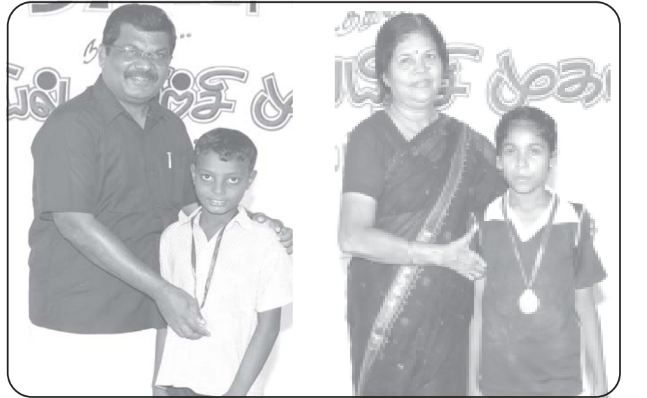
படங்கள்: பவளத்தானூர் தனசேகரன்