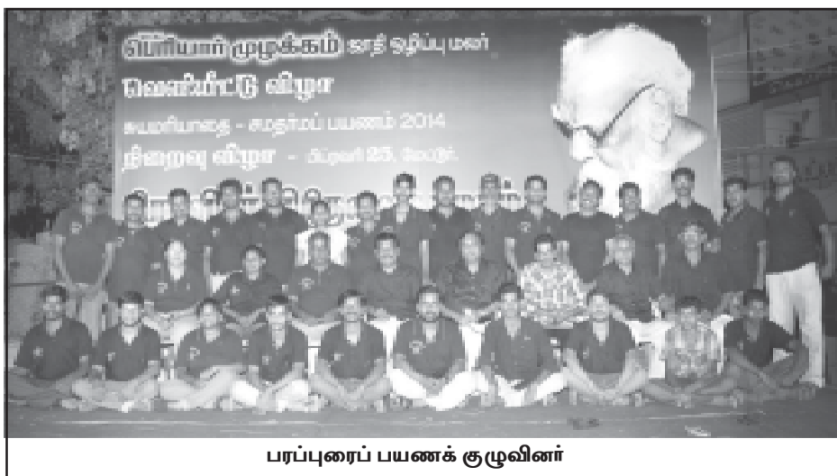
பரப்புரைப் பயணக் குழுவினர்

பிப்.22 காலை 11 மணியளவில் கிருஷ்ணராய புரத்திலும் 12.45 மணியளவில் புலியூர் பேருந்து நிறுத்தம் அருகிலும், மாலை 5 மணியளவில் கரூர் உழவர் சந்தை அருகிலும், இரவு 8 மணியளவில் சின்ன தாராபுரம் பேருந்து நிலையத்தின் அருகிலும் பரப்புரை நடைபெற்றது. மக்களிடம் உண்டியல் ஏந்தி நிதி வசூல் செய்த தோழர் களிடம் மகளிர் தையலகம் நடத்தும் பெண்கள், பெரியார் பெண் விடுதலைக்காகப் போராடியதை நினைவுகூர்ந்து, "நாங்களும் உங்கள் இயக்கத்தோடு இணைந்து பெண் விடுதலைக்காகப் போராடத் தயாராக உள்ளோம்" என்று கூறி தமிழ்ச் செல்வியிடம் தங்கள் முகவரியைப் பதிவு