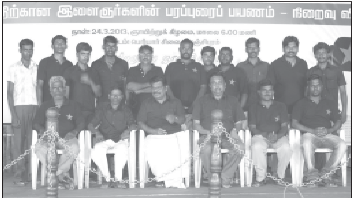
பரப்புரைப் பயணக் குழுவினர்

"இதே காஞ்சிபுரத்தில் 'சாமி' ஊர்வலங்கள் வருகின்றன. அதில் 'சாமி' ரதத்தில் பார்ப்பான் உட்கார்ந்திருக்கிறான். இரண்டையும் தோளில் தூக்கிக் கொண்டு சாலைகளில் ஓடுகிறவர்கள் வன்னியர் சமுதாயத்தைச் சார்ந்தவர்கள்தான். தலித் சமூகத்தினர்கூட சாலையின் ஓரத்தில் ஒதுங்கி நின்று வேடிக்கை பார்ப்பதோடு சரி; இப்படி பார்ப்பனியம் சுமத்தும் இழிவை தூக்கிச் சுமக்கும் சொந்த ஜாதியினரின் இழிவை தட்டிக் கேட்க