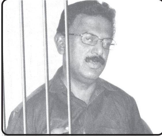
நாளை நான் மறக்கவே விரும்புகிறேன்.

ஒரு பொய்யான செய்தியை தாங்கிக் கொண்டு வந்து ஒட்டு மொத்த தமிழினத்தையும் மார்பிலும் தலையிலும் அடித்துக் கொண்டு அழச் செய்த அந்த