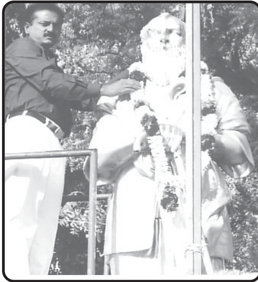
வாயிலில் உற்சாக வரவேற்பு அளிக்கப்பட்டது.