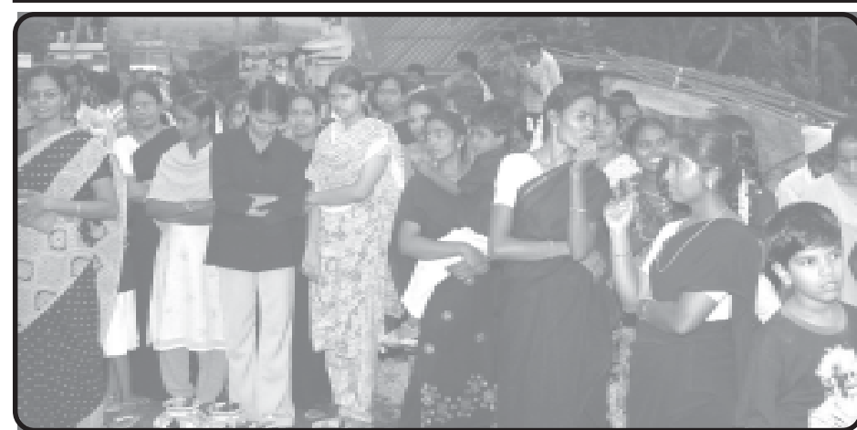
4 ஆம் பக்கத் தொடர்ச்சி