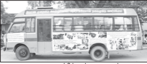
கழகத்தின் பரப்புரை வாகனம்

பயணத்தின் இரண்டாம் சுற்று ஜூலை 23 முதல் மன்னார்குடியிலிருந்து தொடங்குகிறது.