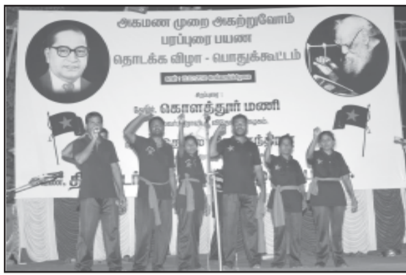
ச.க.ப.க. தோழர்கள் நடத்திய நாடகம்