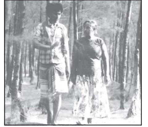
'யாழினி' திரைப்படத்தில் ஒரு காட்சி