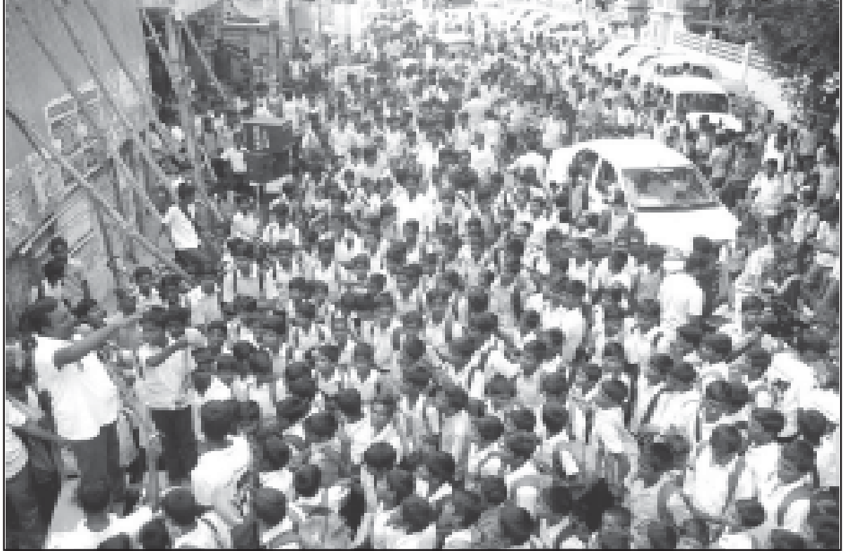
மயிலாடுதுறை நகராட்சி மேனிலைப் பள்ளி முன்

பகல் 1.30 மணியளவில் ஏ.வி.சி. கலைக் கல்லூரியில் பரப்புரை நடைபெற்றது. மாணவர்கள் இயக்கத்தில் சேர்ந்து பணியாற்ற மாணவர்கள் முகவரிகளை பதிவு செய்தனர்.