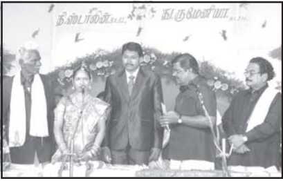
6.7.2011 புதன்கிழமை அன்று