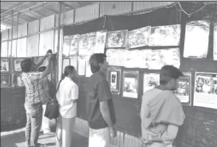
பாட்டாளி படிப்பகத்தின் சார்பில் அமைக்கப்பட்டிருந்த பெரியார் வரலாற்றுப் புனைப்படக் கண்காட்சியை ஏராளமான இளைஞர்கள் பார்த்தனர்