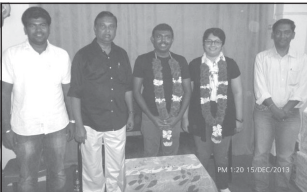
PM 1:20 15/DEC/2013

இயக்க வளர்ச்சிக்கு ரூ.15000-த்தை பொதுச் செயலாளரிடம் மணமக்கள் வழங்கினர்.