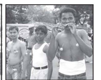
மேலும் பேரணி காட்சிகளை திராவிடர் விடுதலைக் கழக முகநூலில் காணலாம்