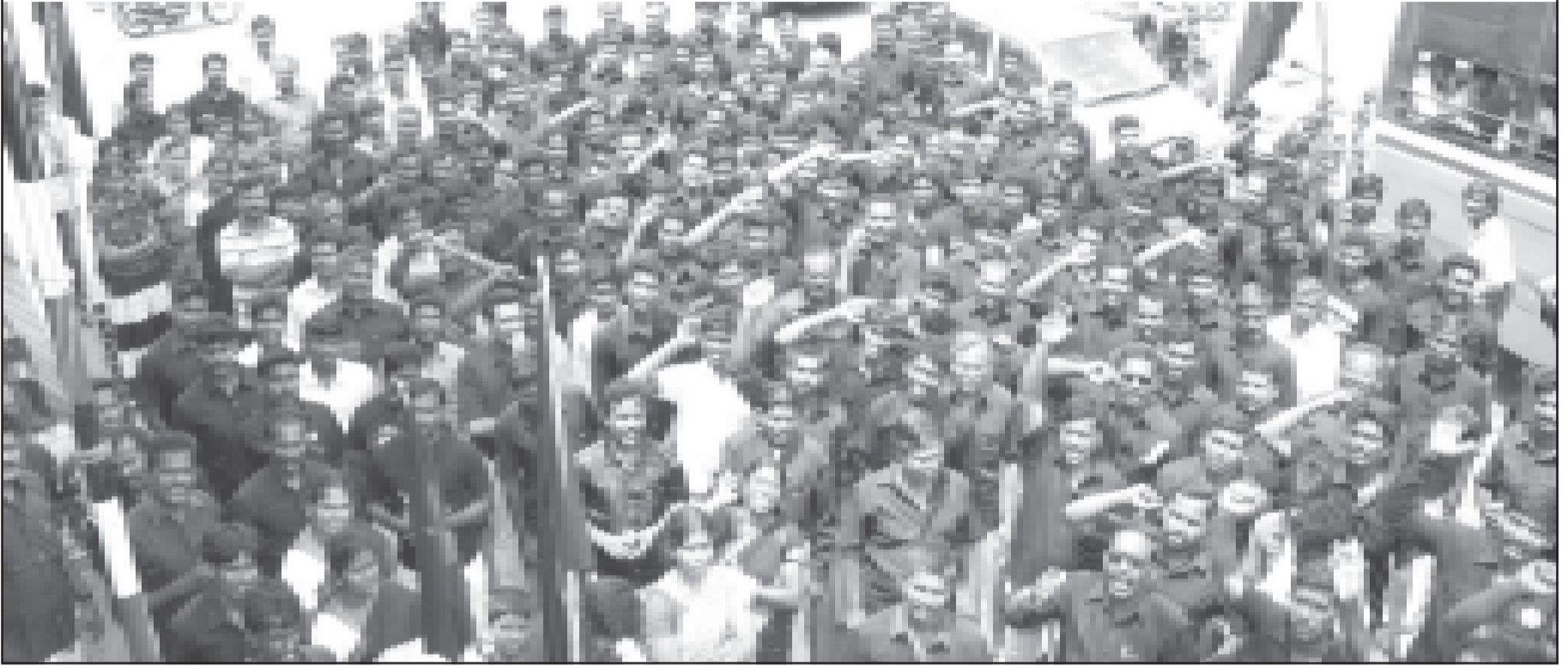
பெரியார் சிலைக்கு மாலை அணிவித்தபோது....