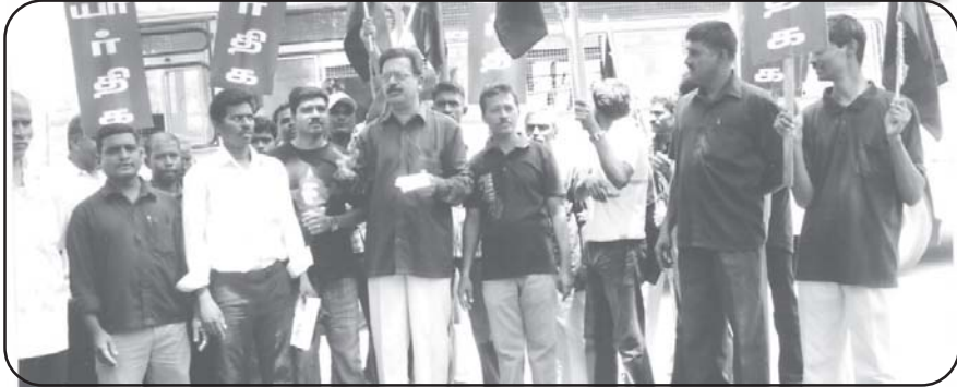
(முதல் பக்கத் தொடர்ச்சி)

கோவையில் மூடநம்பிக்கைகளை பரப்புகிற வகையில் 12 ராசிகளுக்கு அஞ்சல்தலை வெளியிட்ட அஞ்சல் துறையைக் கண்டித்து ஆர்ப்பாட்டம் நடத்திய கழகத்தினர் 40 பேர் கைதானார்கள். அறிவியலுக்கு எதிராக மூடநம்பிக்கையை பரப்புகிற தன்மையில் அஞ்சல்துறை 12 ராசிகளுக்கு சிறப்பு