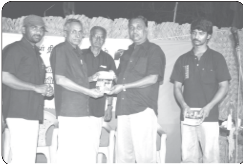
போடியில் பயணத்தின் தொடக்க நிகழ்வில் 'தமிழகத்தில் - சாதி, தீண்டாமை கொடுமைகள்' கள ஆய்வு நூலை கழக சார்பில் வெளியிடப்பட்டபோது...

15.4.2010 அன்று காலை 9.35 முதல் 10.15 வரை தேவாரம் பேருந்து நிலையம் அருகில். திருப்பூர்